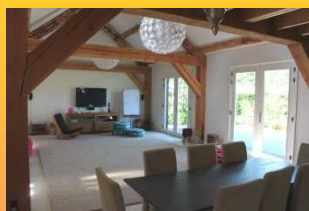
Allium Partners, Opijnen