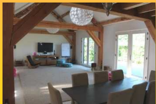
Allium Partners, Opijnen