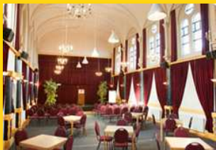
De Beukenhof, Biezenmortel

http://www.pointzero.ro/fepto/members/founding-members/teszary-judith